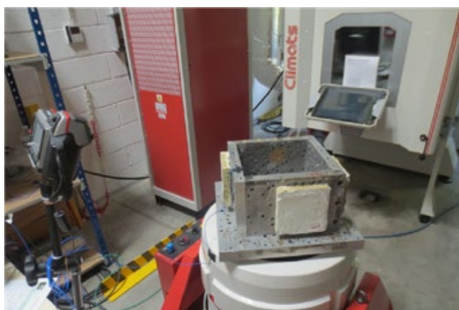
Vibraatiotesti - SILACOLL