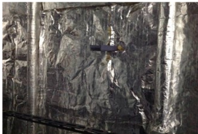
Lähikuva - kiinnitetyt eristelevyt