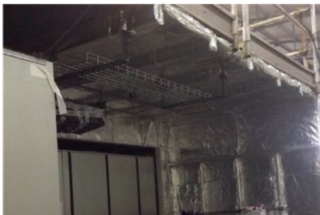
Eristelevyjen kiinnitys teräseinään