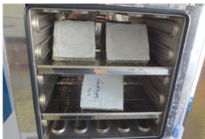
SILACOLLin ikääntymistestissä käytetty Ilmastokammio