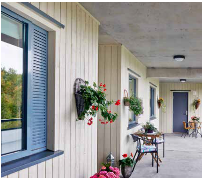
Lian Brannstopp -palosulku sulautuu julkisivuun huomaamattomasti.