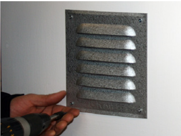
3. asenna hyväksytyt suojasäleiköt seinän molemmille puolille.