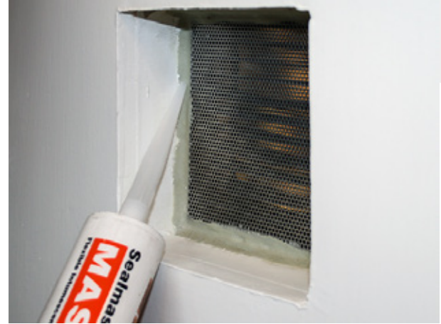
2. tiivistä venttiilin ja seinän välinen rako palomassalla.