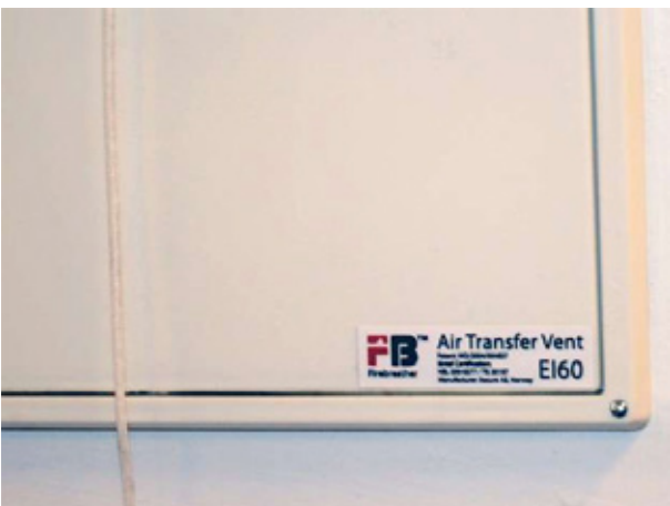
4. liimaa tuotetarra näkyvälle paikalle suojasäleikön tai -luukun ulkopintaan.