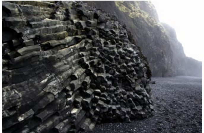
Basaltti on lähes ehtymätön luonnonvara, sillä noin kolmannes maan kuoresta on basalttia.

Basalttikuitutango on suunniteltu käytettäväksi teollisuus-, infra- ja asuinrakentamisessa. Basaltti toimii parhaiten ympäristöissä, joissa rakenne hyötyy betonin keveydestä ja hyvistä korroosionsietokyvyistä. Tällaisia tilanteita olisi projekteissa, jossa rakenteet vaativat korkeaa